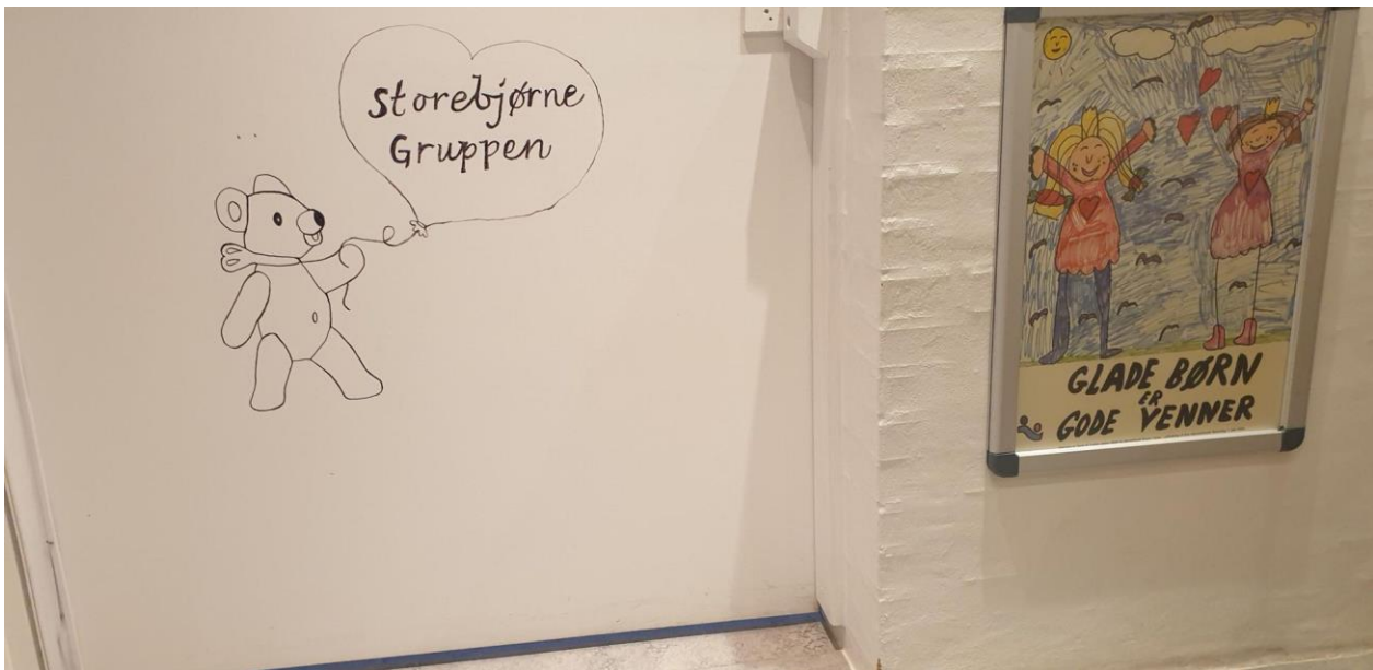
Foto: Lågen ind til de tildelte rum for StoreBjørne-Gruppen, som er for de ældste børn i vuggestuen.