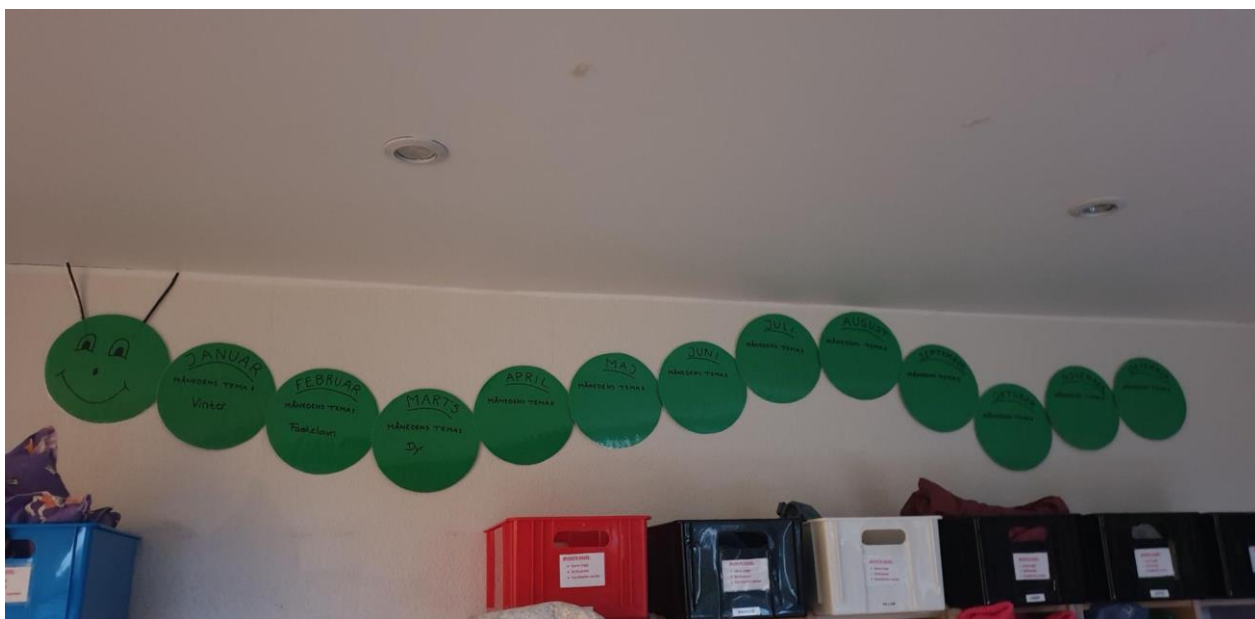
Foto: Tema Larve, der synliggør for forældrene i garderoben, hvilke temaer vi har haft og påtænker i løbet af året.

Vi laver brainstorming af temaer for det næste år. Temaerne er valgt ud, så de passer med vores årshjul og de årstidsbestemte aktiviteter. Aktiviteterne er koblet på de 6 temaer fra den styrkede læreplan, så vi således kommer omkring alle temaer én eller flere gange om året, desuden har vi de tilhørende pædagogiske mål for sammenhængen mellem det pædagogiske læringsmiljø og børnenes læring med i planlægningen.